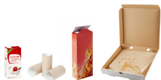
EMBALLAGES EN PAPIER ET CARTON