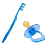
OBJETS EN PLASTIQUE