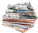
JOURNAUX ET MAGAZINES